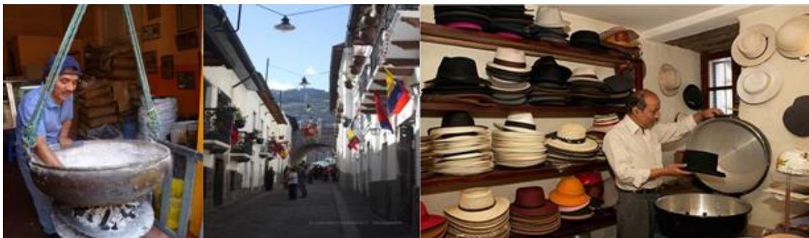
Ночь в отеле Casa Gangotena Boutique Hotel.